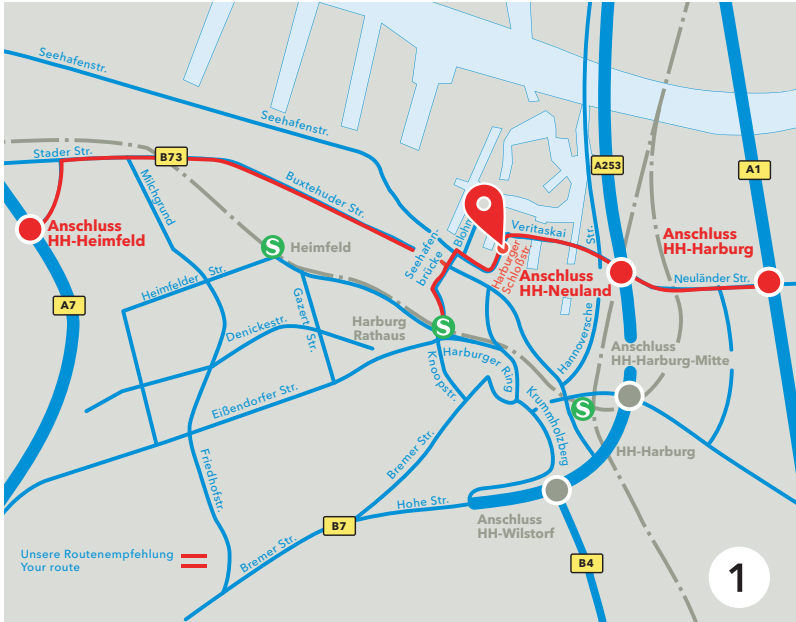
Auf unserer Webseite finden Sie in der Fußzeile die Wegbeschreibungen zu allen Standorten.